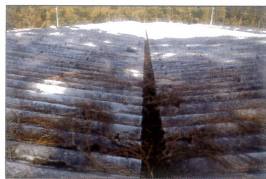
工種：屋根工事 種別：既存現状 屋根工事 駐輪場 施工前