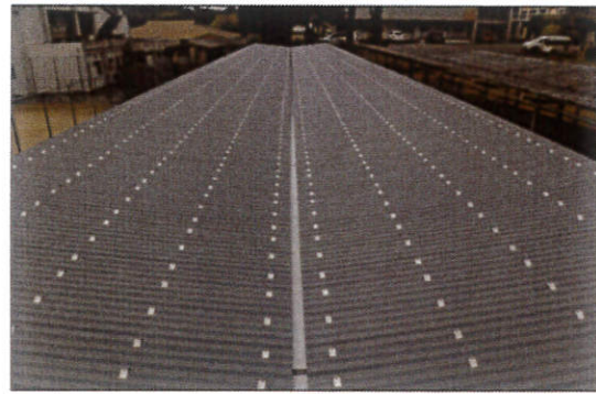
工種：屋根工事 種別：施工完了 屋根工事 駐輪場 施工完了