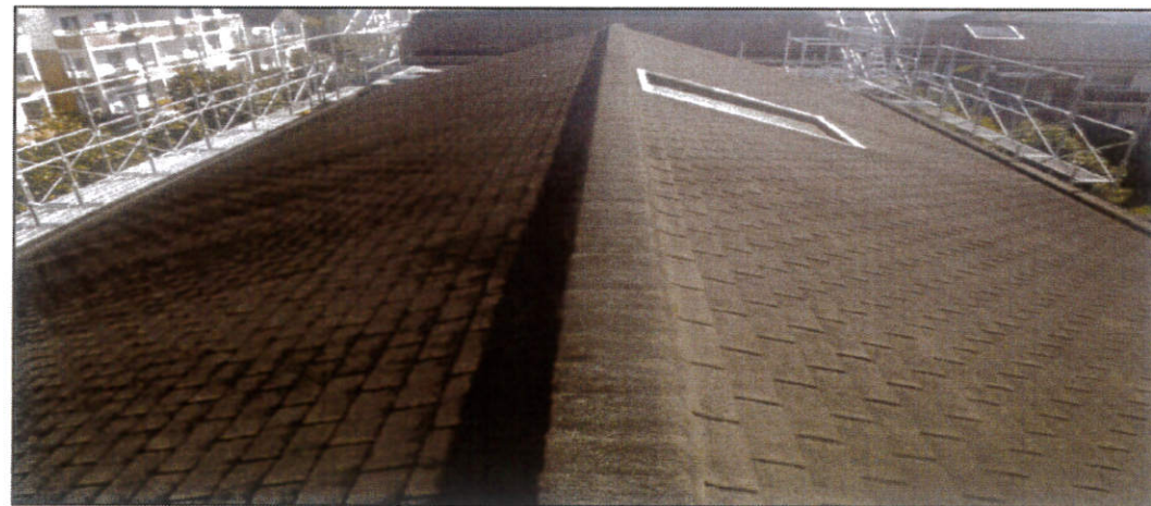
工種：屋根工事 種別：施工前 屋根工事 既存屋根 施工前