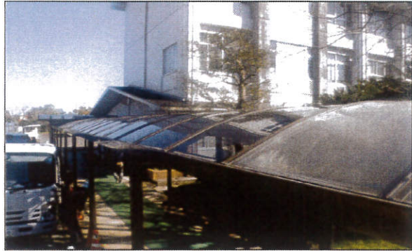
工種：屋根工事 種別：施工完了 屋根工事 渡り廊下 施工完了