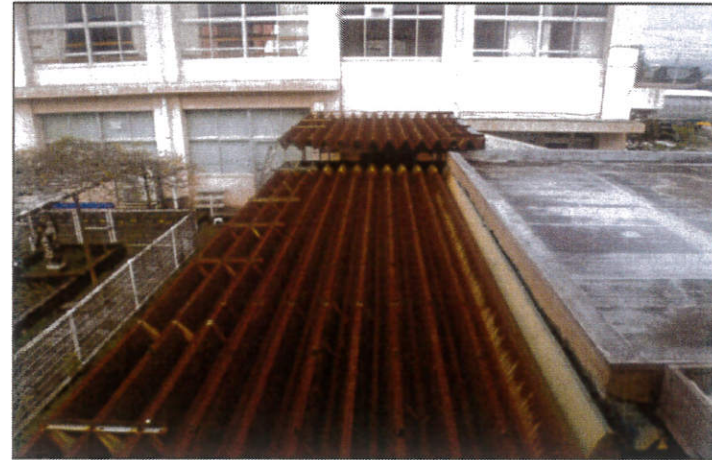
工種：屋根工事 種別：施工前 屋根工事 渡り廊下 施工前