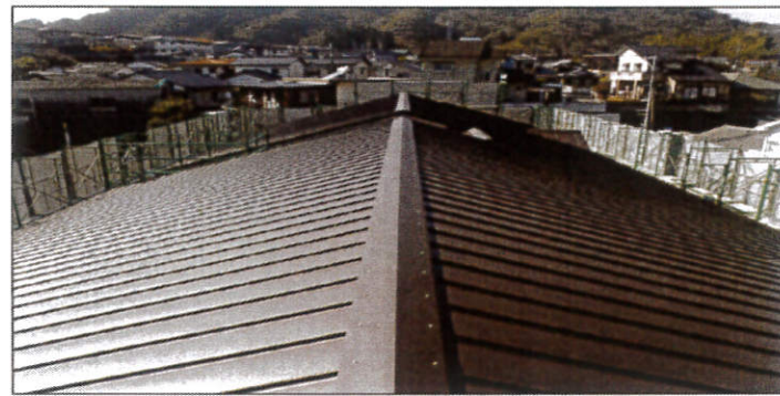
工種：屋根工事 種別：施工完了 屋根工事 施工完了