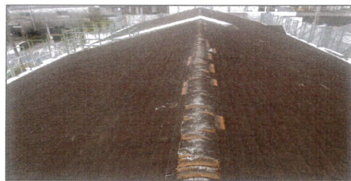
工種：屋根工事 種別：施工前 屋根工事 既存屋根 施工前