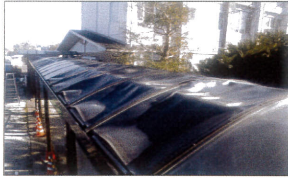
工種：屋根工事 種別：施工前 屋根工事 渡り廊下 施工前